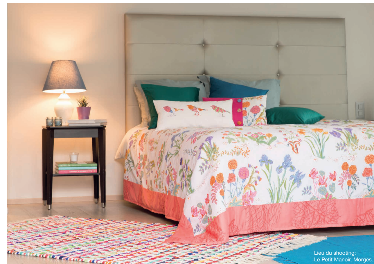
Lieu du shooting: Le Petit Manoir, Morges.

DE NOMBREUSES FONCTIONNALITÉS TRÈS PRATIQUES RENDENT VOS TRAVAUX DE COUTURE PLUS FACILES, PLUS RAPIDES ET PAR CONSÉQUENT PLUS AGRÉABLES.