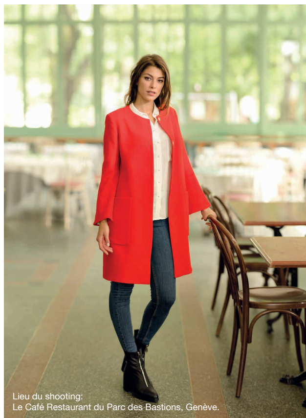
Lieu du shooting: Le Café Restaurant du Parc des Bastions, Genève.

De plus, la version 570α comprend un alphabet avec des lettres minuscules et majuscules, des chiffres et des symboles. La fonction mémoire de ce modèle vous permet de créer des combinaisons de points personnelles et uniques ou de programmer du texte et des noms.