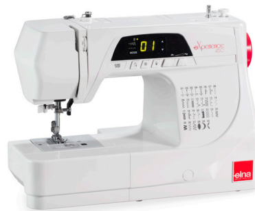
MACHINE À COUDRE ÉLECTRONIQUE