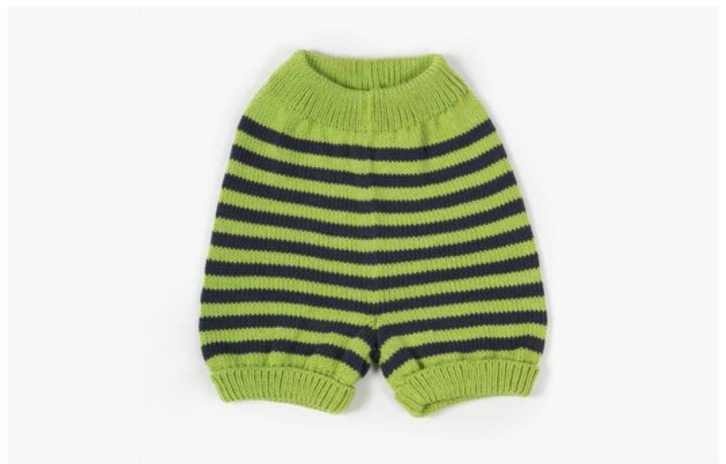
M1372 BBBBBB p.38