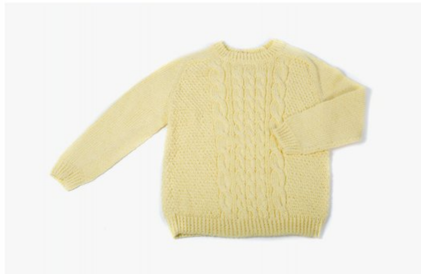
M1352 BBBBBB p.13