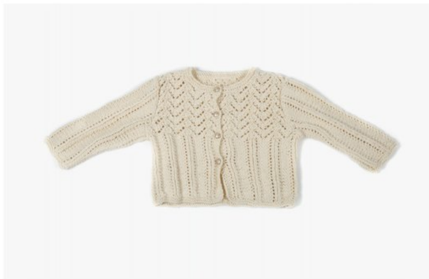
M1347 BBBBBB p.09