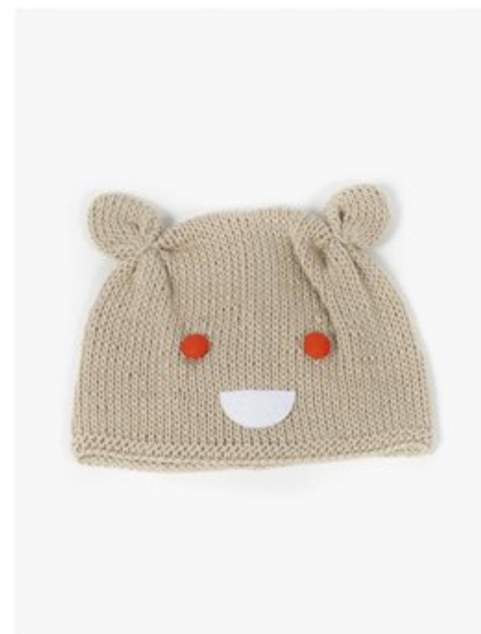
M1349 BBBBBB p.11