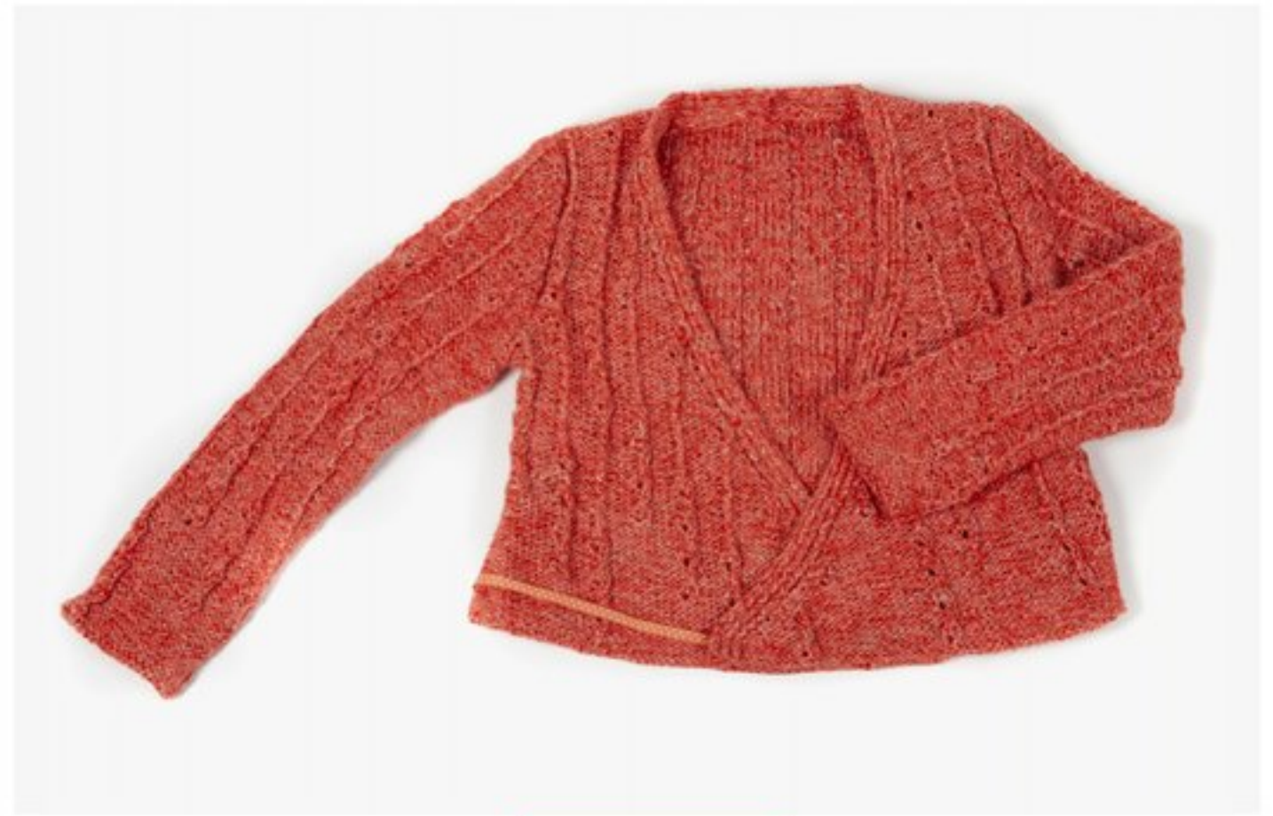
M1367 BBBBBB p.30