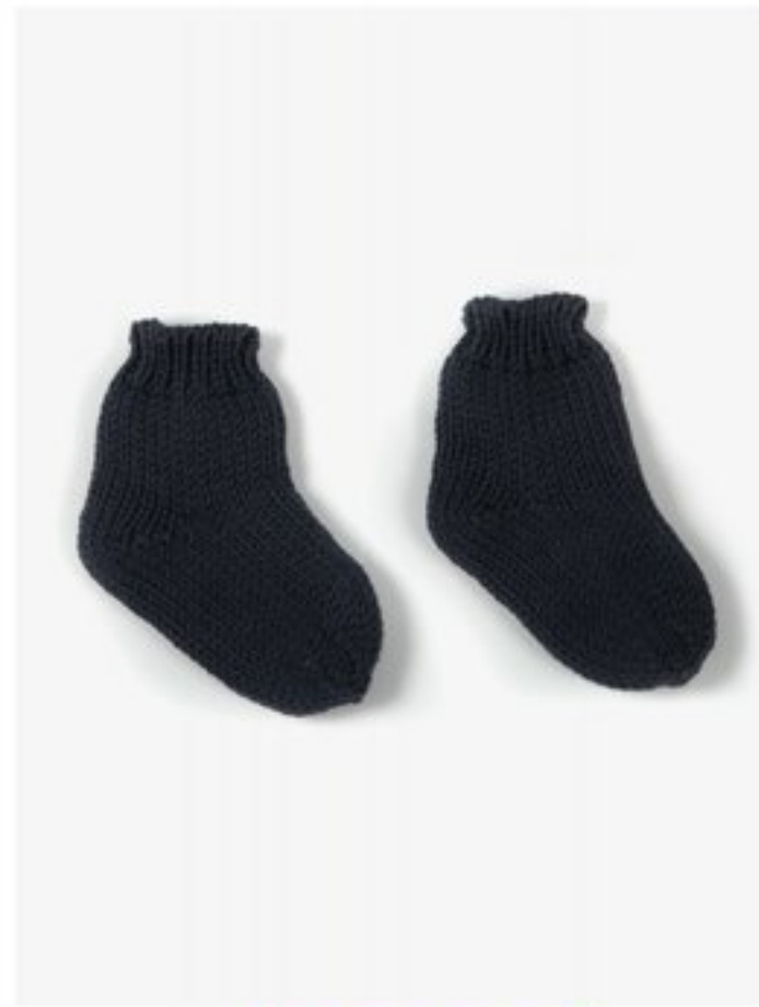
M1360 BBBBBB p.21