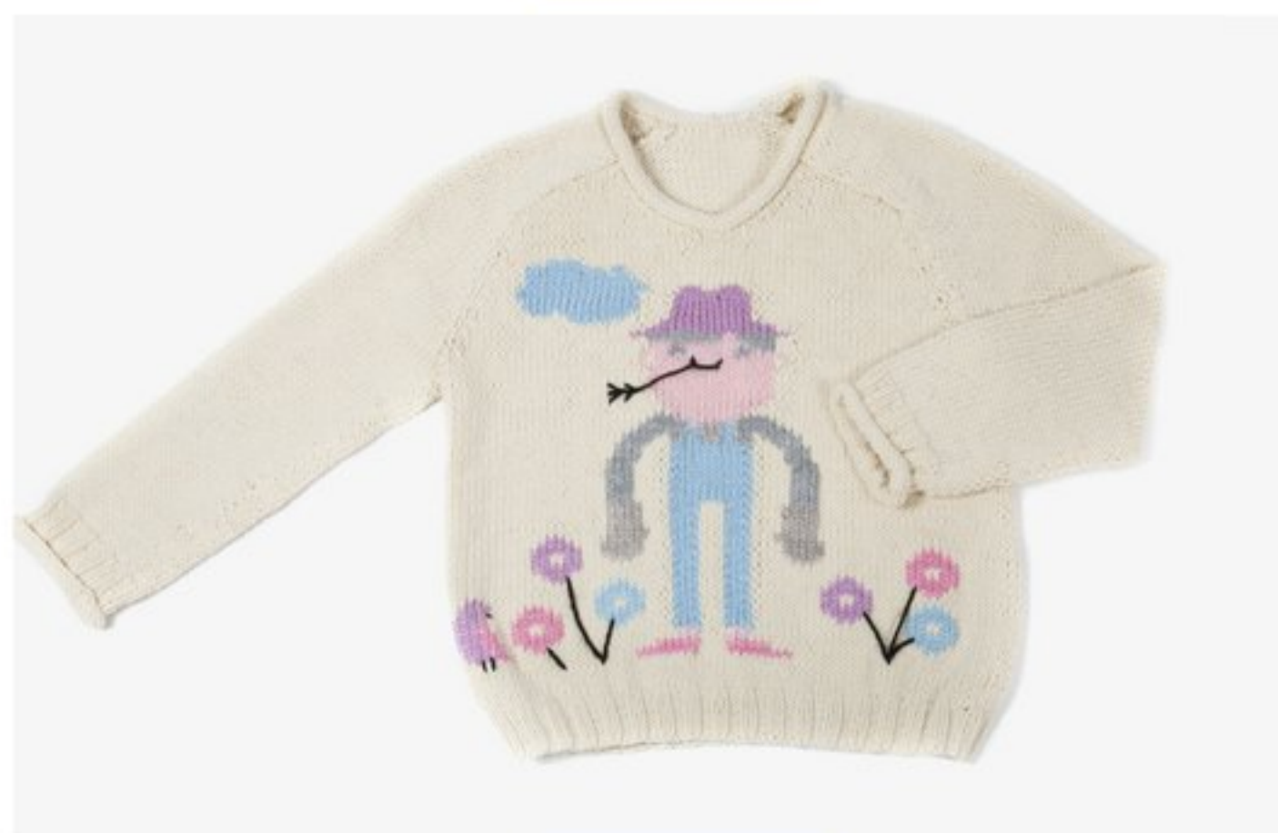
M1354 BBBBBB p.15