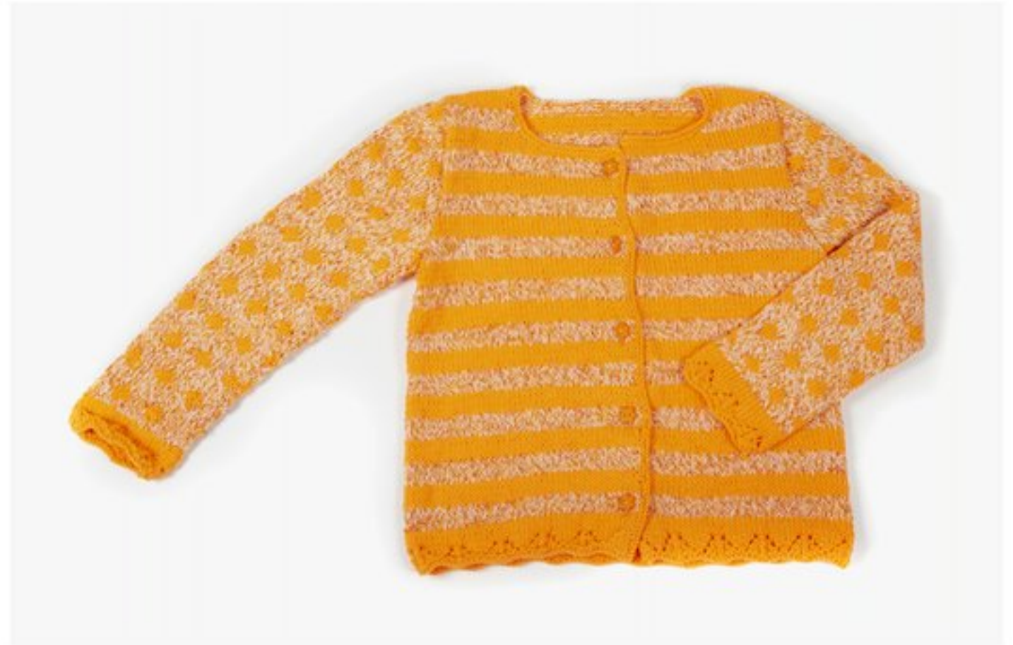
M1368 BBBBBB p.23