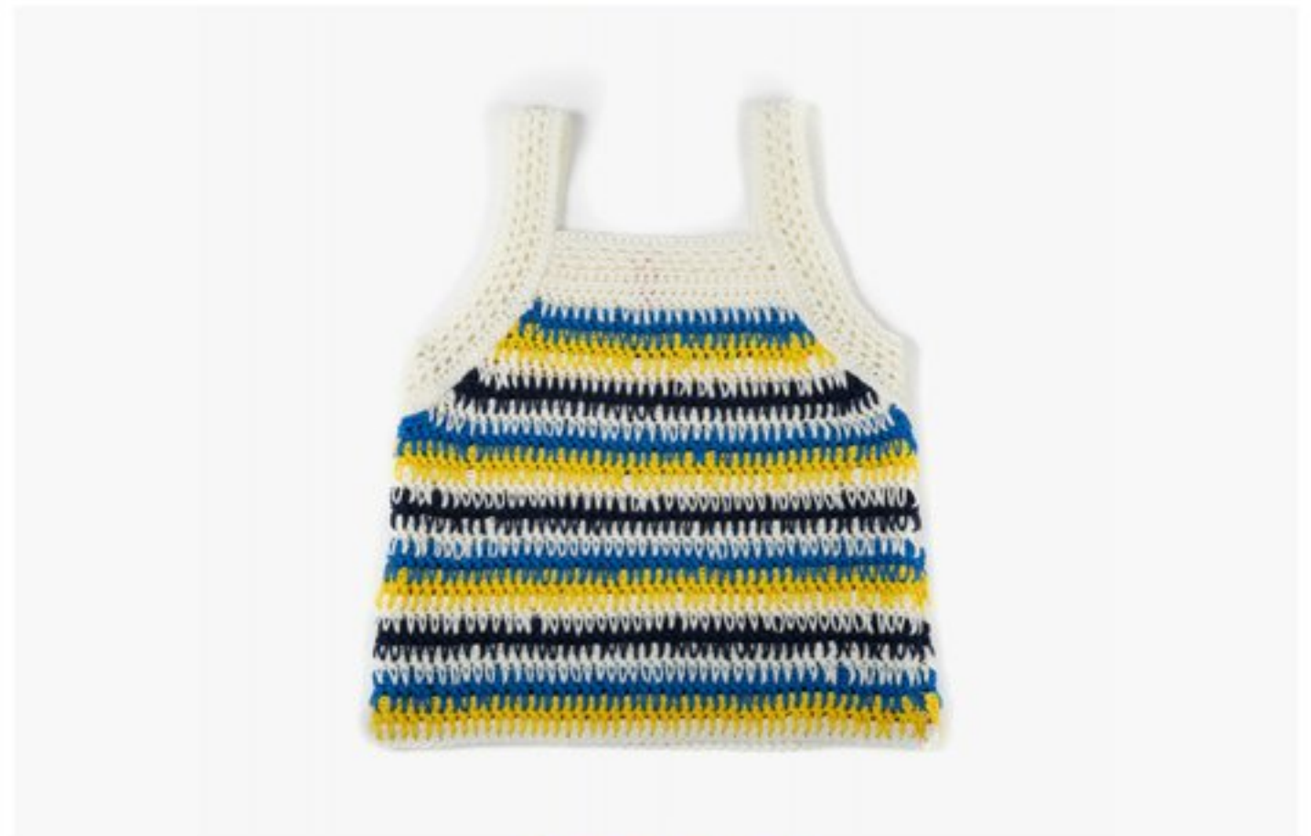
M1370 BBBBBB p.34