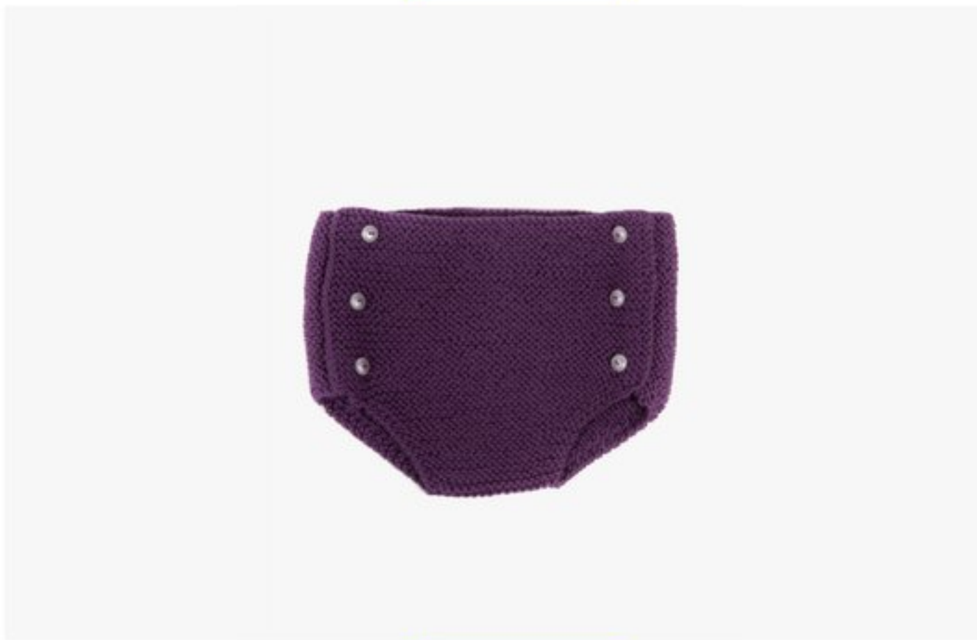
M1362 BBBBBB p.24