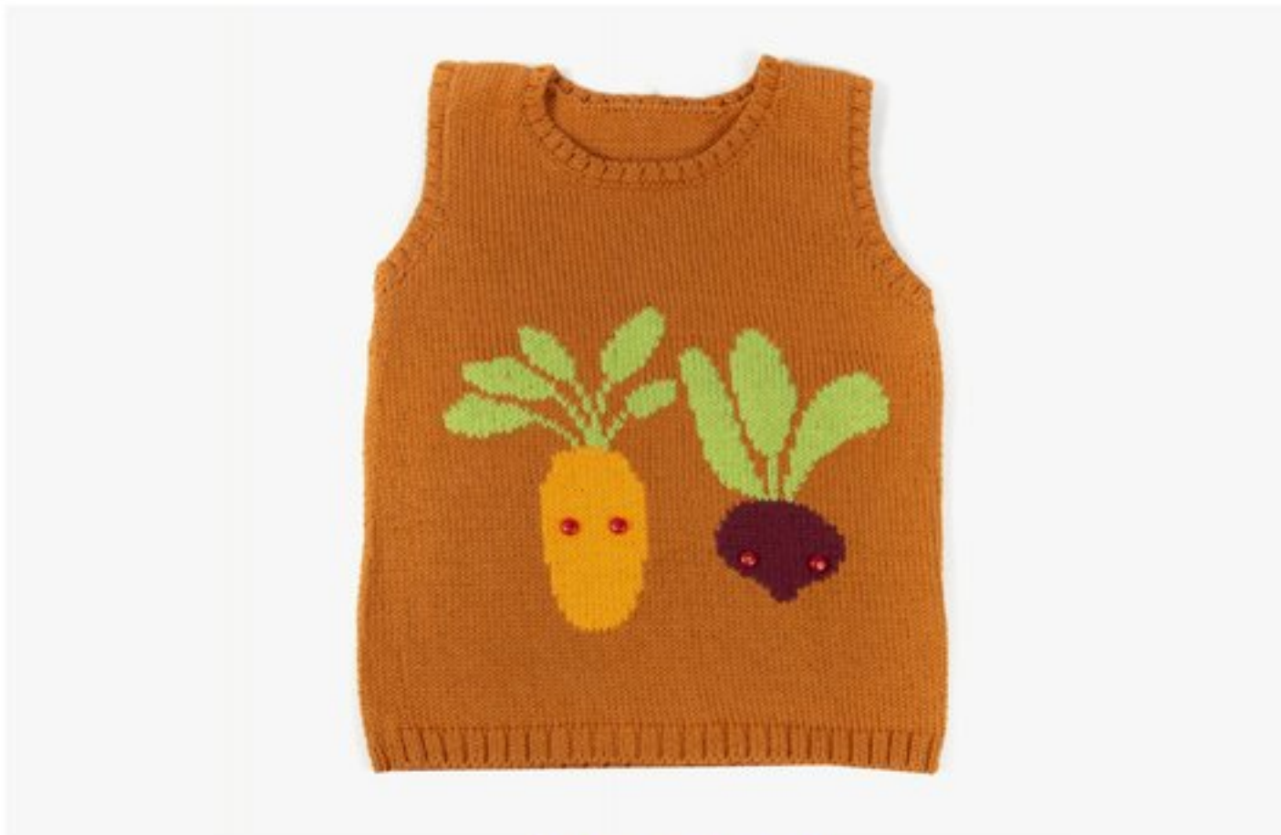
M1369 BBBBBB p.32