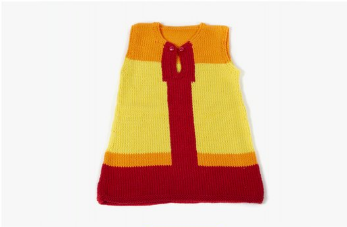
M1364 BBBBBB p.22