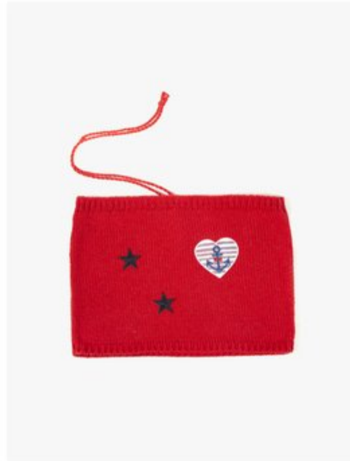
M1366 BBBBBB p.28