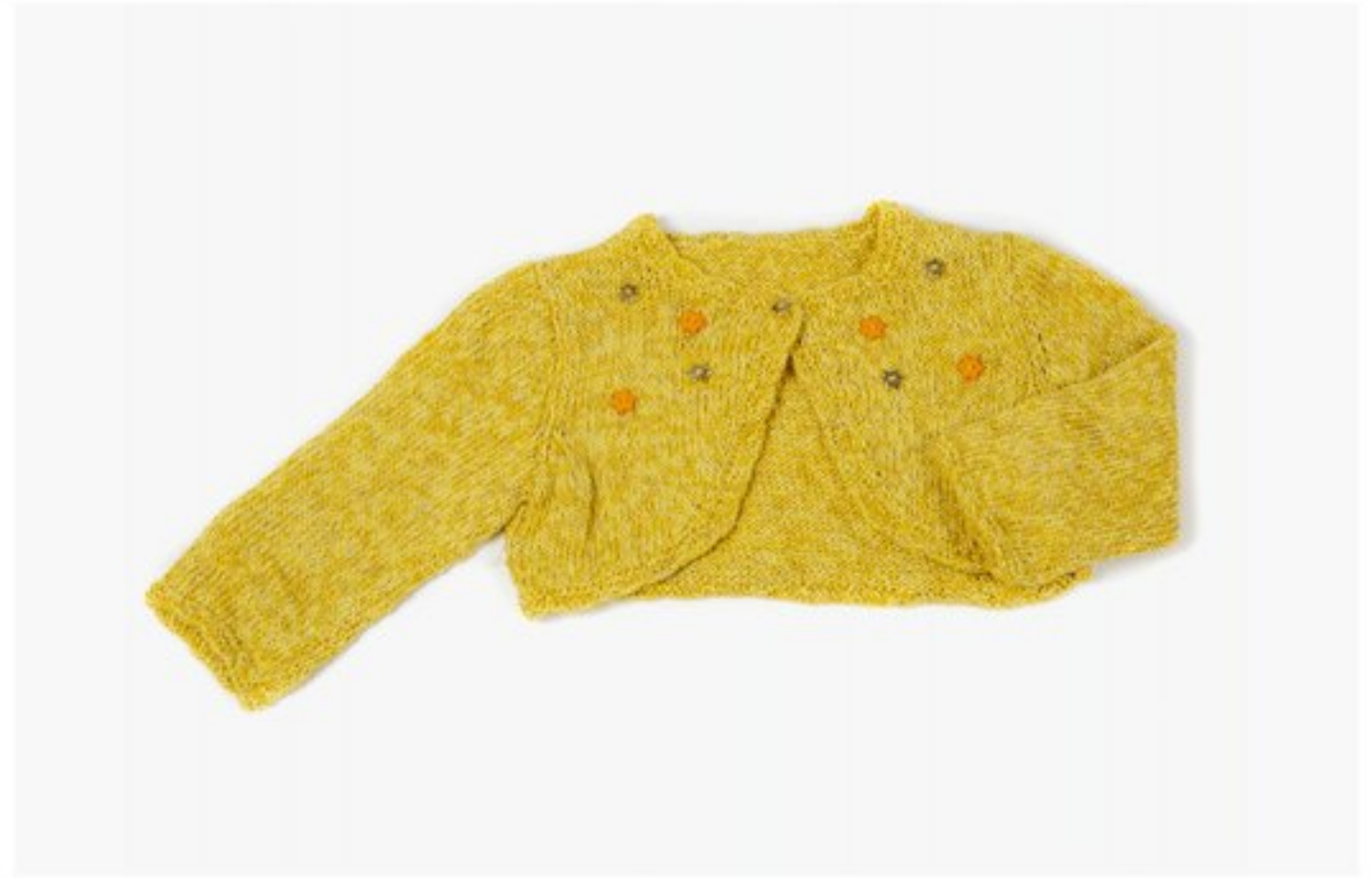
M1358 BBBBBB p.19