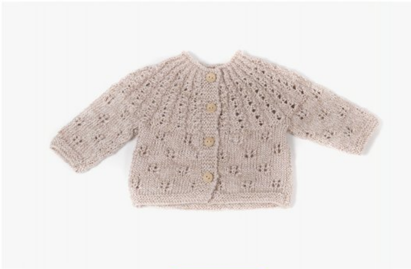
M1355 BBBBBB p.14