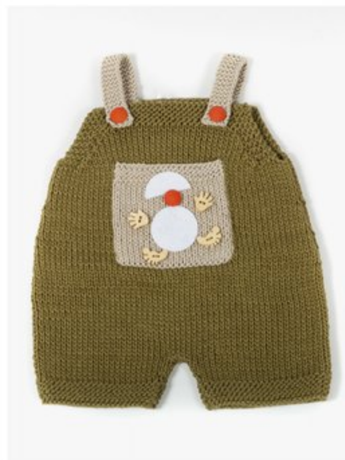
M1348 BBBBBB p.10