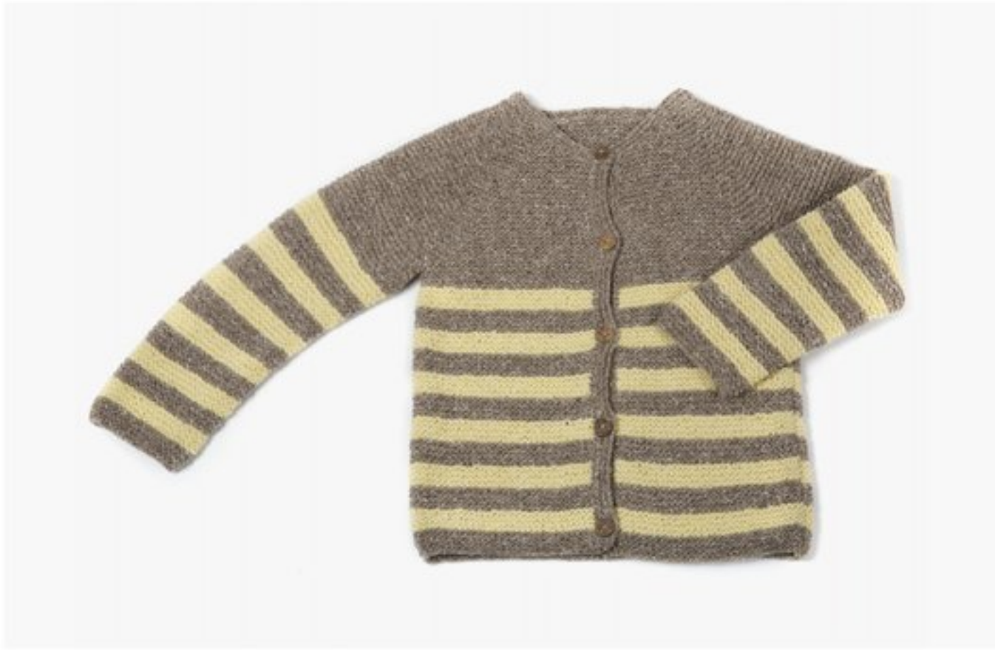
M1357 BBBBBB p.18