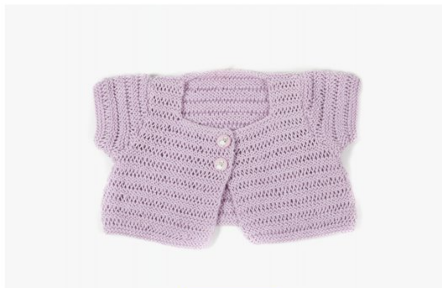
M1346 BBBBBB p.08