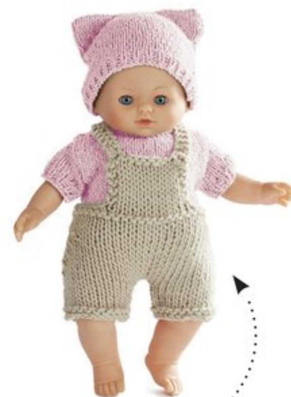
Kit tenu rose à tricoter réf. 30781

Livré nu - 2 tailles : Hauteur 28 cm - Réf. 55594 Hauteur 36 cm - Réf. 30618