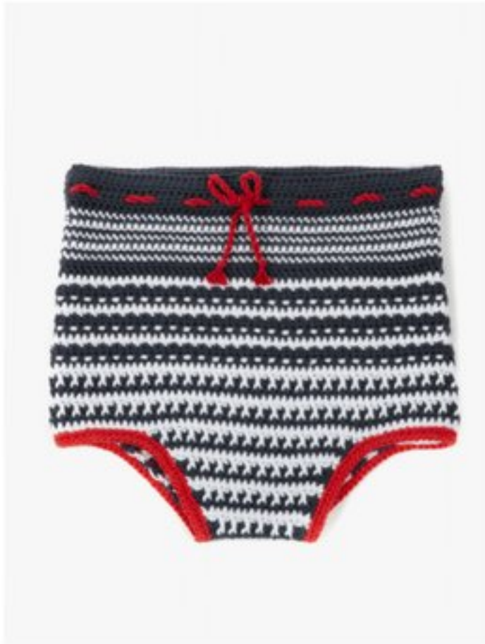
M1365 BBBBBB p.28