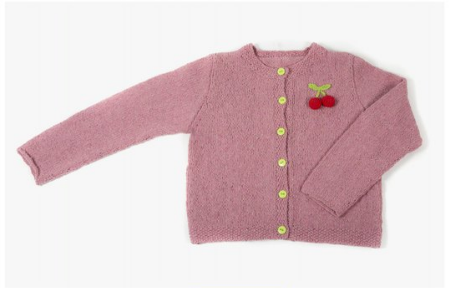
M1356 BBBBBB p.17