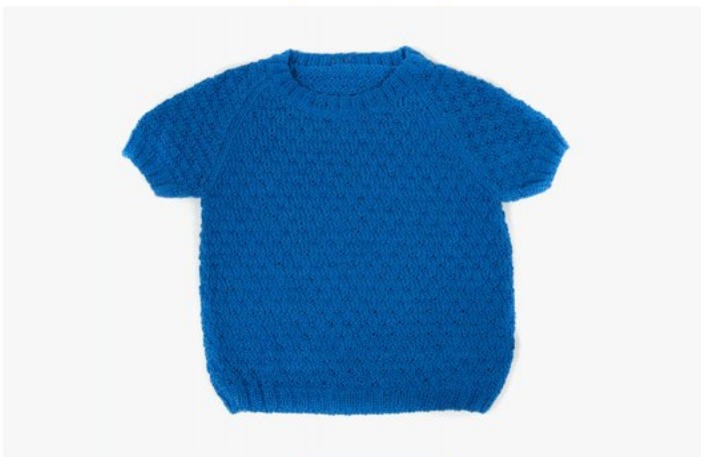
M1371 BBBBBB p.36