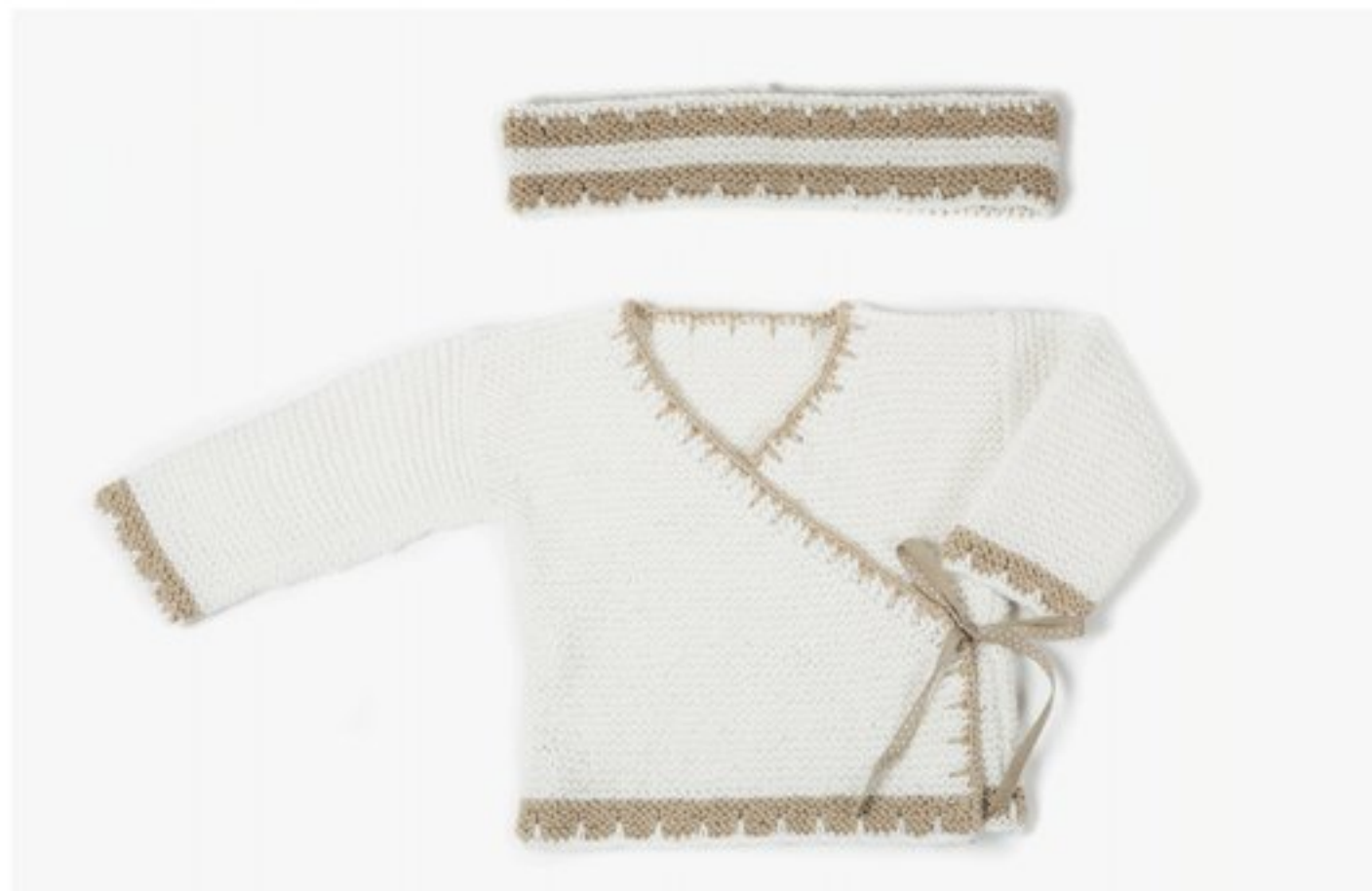
M1350 - M1351 BBBBBB p.12