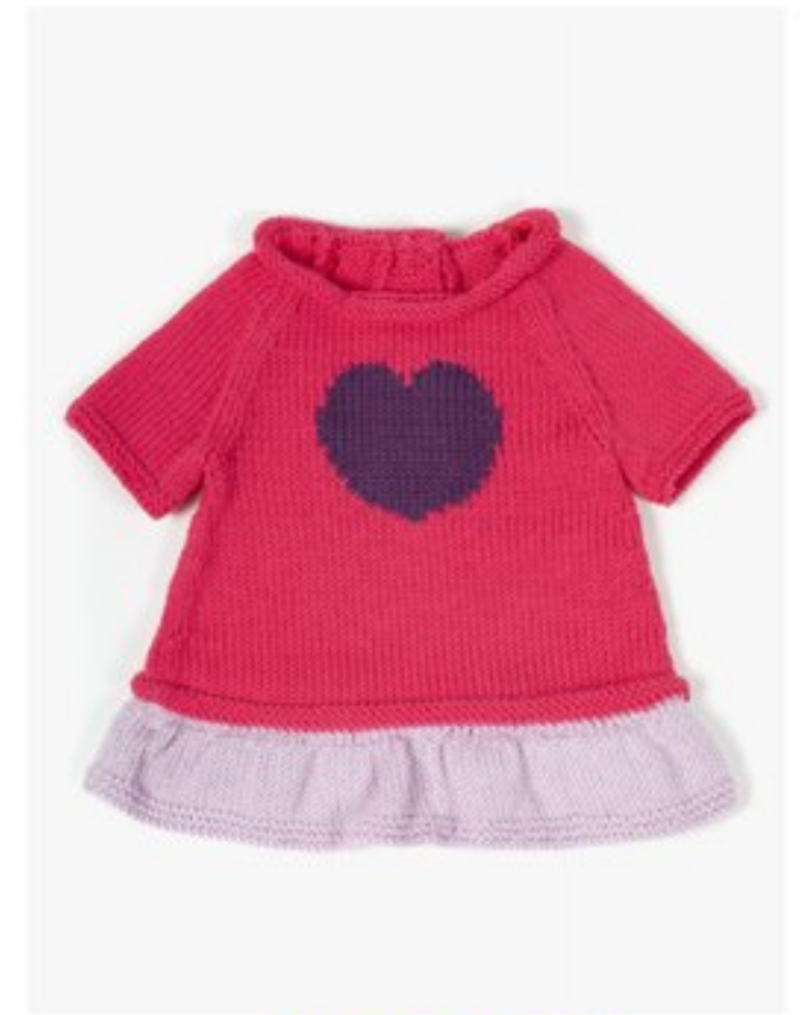
M1361 BBBBBB p.24