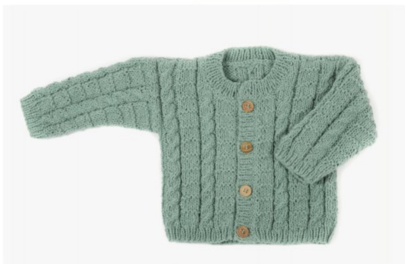
M1353 BBBBBB p.16