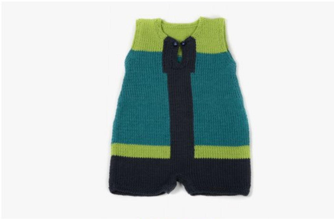
M1359 BBBBBB p.20