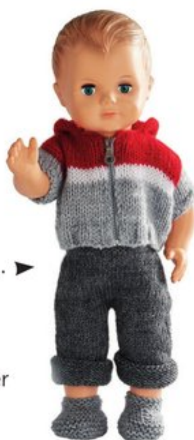
Kit tenu à tricoter réf. 30615