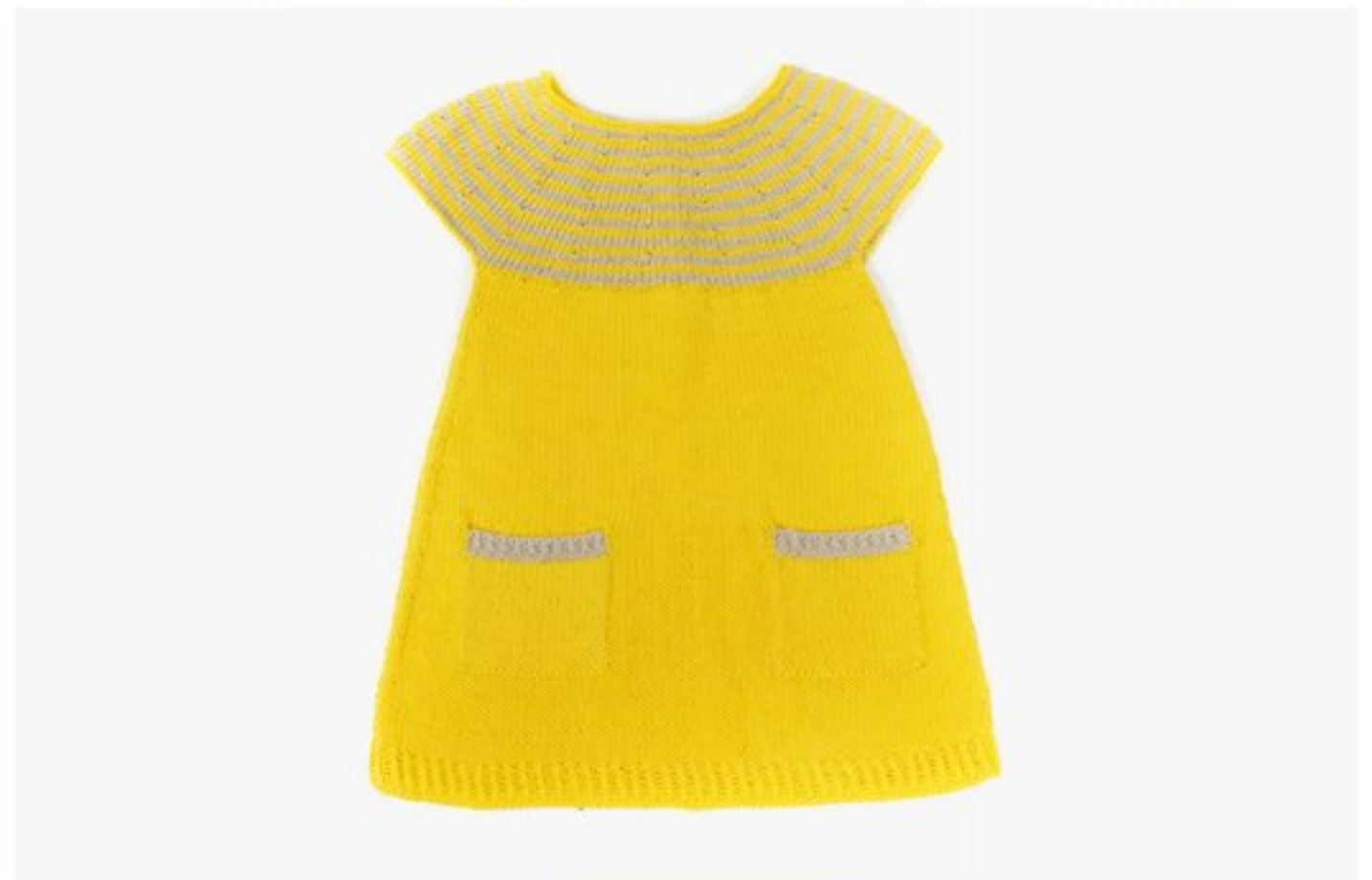
M1363 BBBBBB p.26