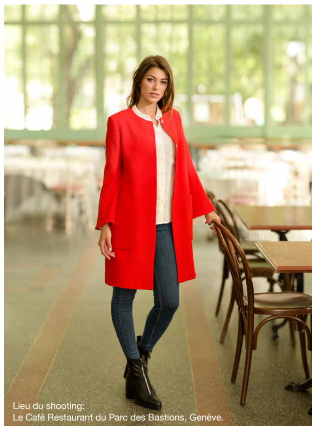
Lieu du shooting: Le Café Restaurant du Parc des Bastions, Genève.

Peu importe que vous recherchiez l'aspect décoratif ou fonctionnel, vous saurez apprécier la précision et la qualité régulière de tous ces points. La fonction mémoire du modèle 570α vous permet de créer des combinaisons de points personnelles et uniques ou de programmer du texte et des noms.