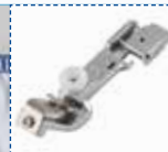
Pied bordure (élastique)

Pour coudre un ruban sur le bord d'un tissu extensible.