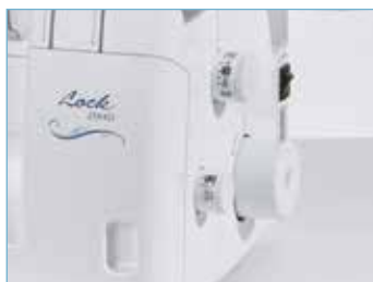
Accès simplifié aux réglages