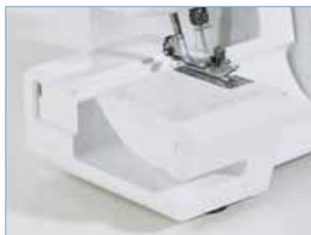
Bras libre et plan de travail extra-plat