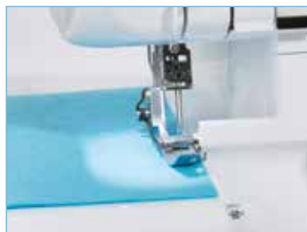
Eclairage par LED du plan de travail