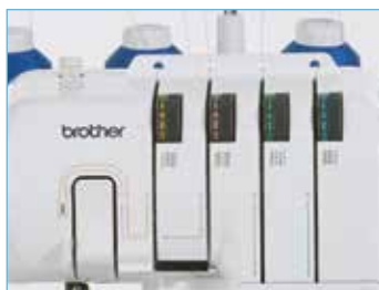
Guide d'enfilage avec repères en 4 couleurs