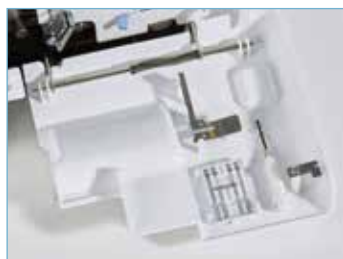
Rangement astucieux des accessoires