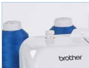
Contrôle de la pression du pied presseur