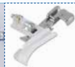
Pied pose-perles et paillettes

Pour la pose de perles et de paillettes sur le bord d'un tissu.